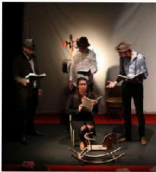
Cette année, pour Andromaque , les artistes de la Ville des Herbières ont une aide technique et artistique. C'est une façon pour nous

Pendant ces jours de création, les artistes des arts et de la musique des Herbières de la Ville des Herbières ont une aide technique et artistique. C'est une façon pour nous